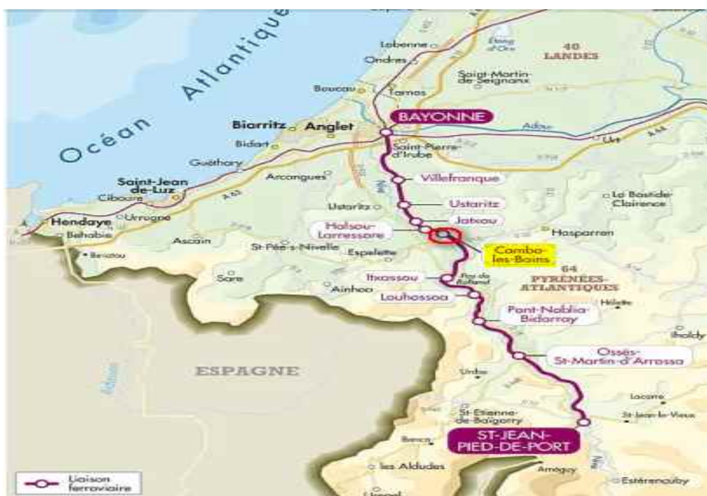
Figure 1 : Schéma de la ligne Source Google, légende BEA-TT

La gare de Cambo-les-Bains est une gare temporaire : elle est ouverte en 2X8 pour assurer le service de la circulation. Un agent circulation (AC) est présent au poste de la gare pour chaque période d'ouverture.