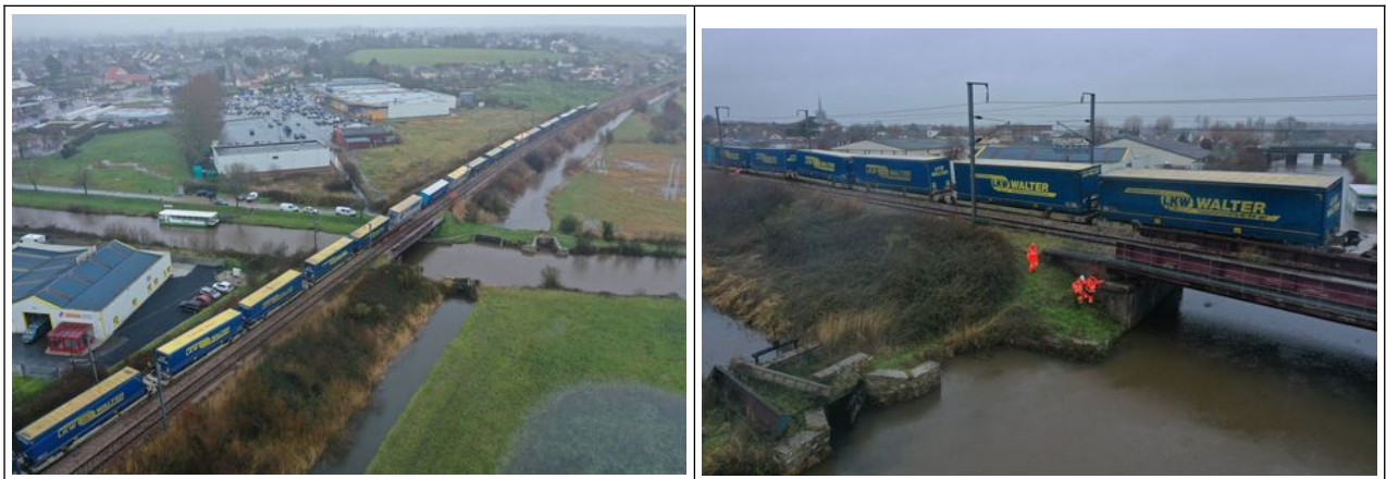
Vues aériennes du train déraillé

De lourdes opérations de relevage nécessitent l'utilisation d'outils spécifiques (grue Kirow). Les circulations ferroviaires sont interrompues pour plusieurs semaines. Des substitutions par la route sont organisées pour offrir des alternatives aux passagers des TER.