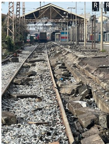
Quai détruit en gare de Carcassonne