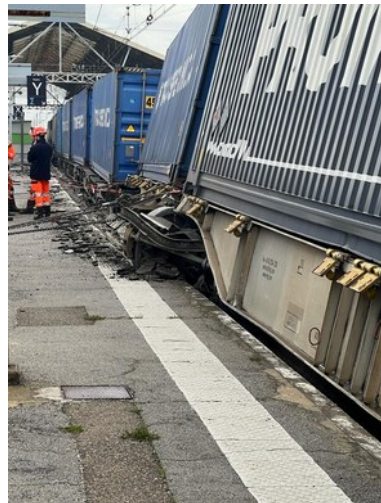
Bogie central du 23 e wagon