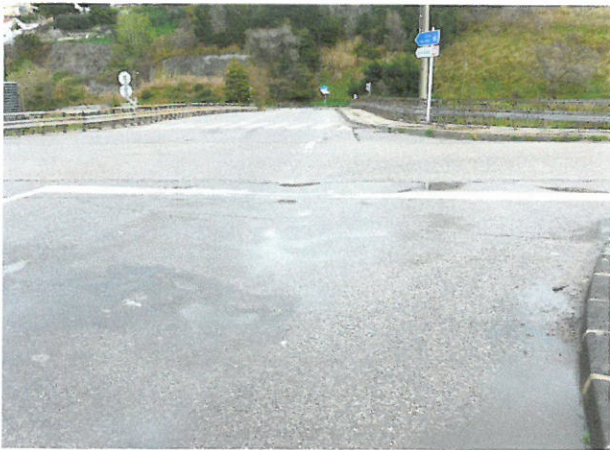
Sortie Porte 4