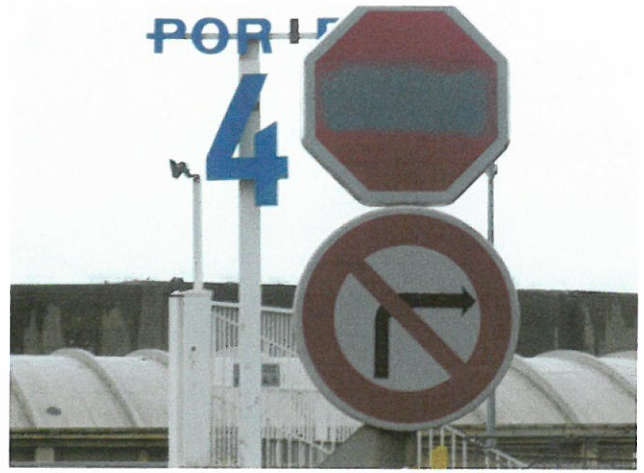
FACE Porte 4 PONT