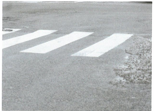
FACE Porte 4 PONT