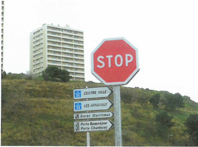
Sortie Porte 4