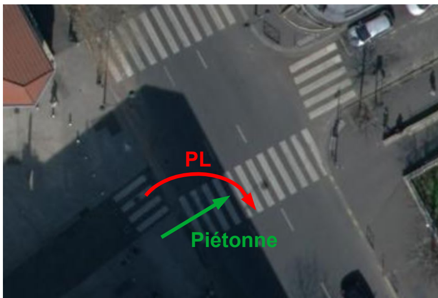
Mouvements présumés du PL et de la piétonne

La piétonne traversait le boulevard Jean-Jaurès sur un passage pour piétons positionné dans le prolongement du trottoir de la rue de Neuilly.